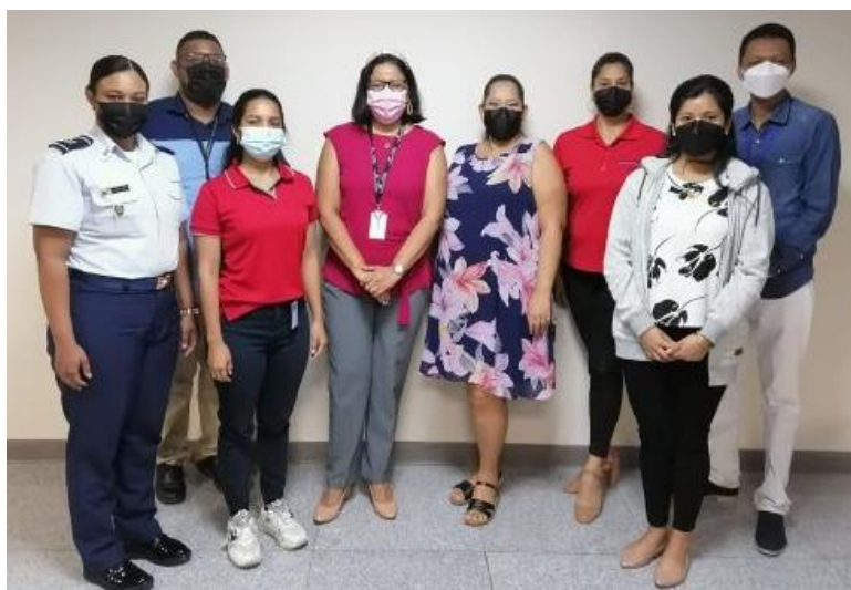
Ilustración 2 Participación presencial de 7 instituciones en la reunión del 16 de noviembre de 2021.